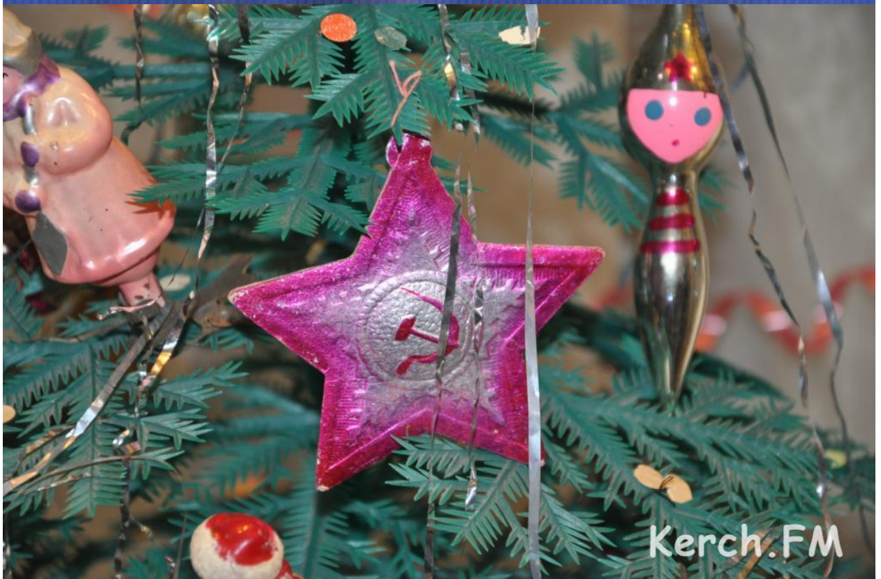
В 1970-е годы выпускались игрушки на прищепках.